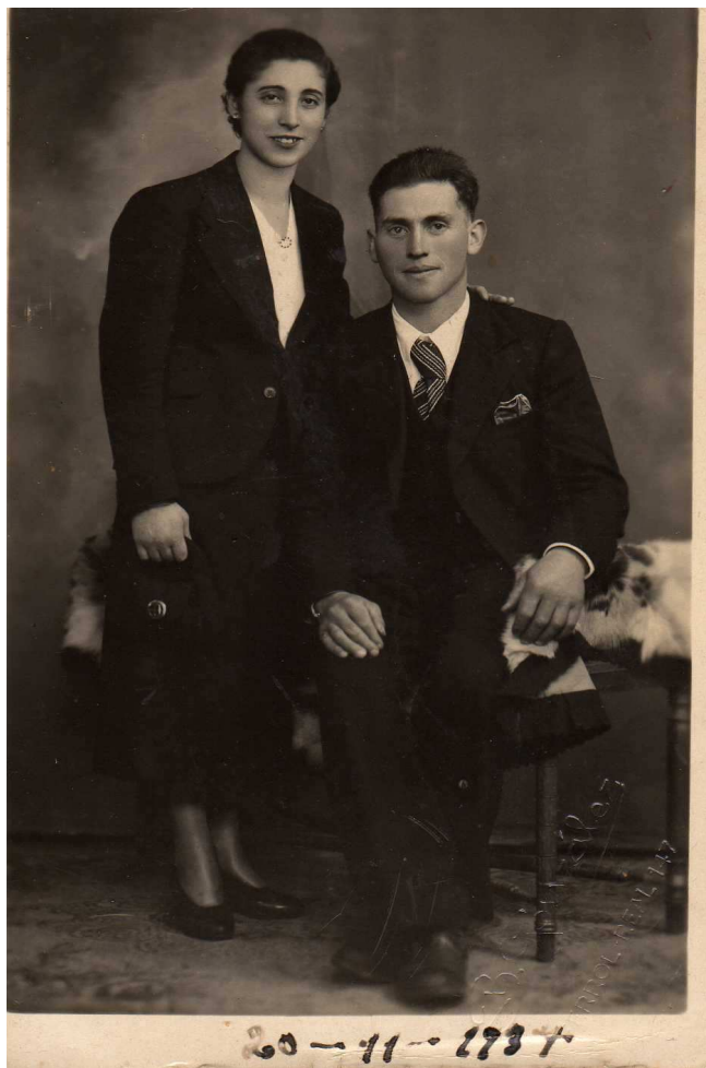
Mozos de S. Xoán casados no ano 1937.