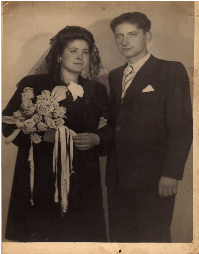
Mozos de S. Xoán casados nos anos trinta.