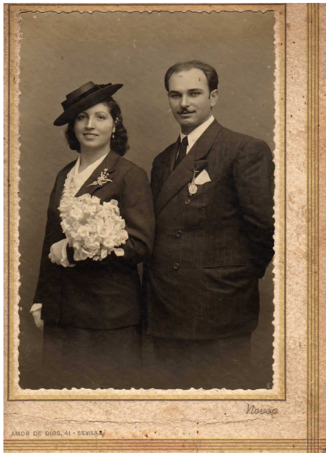
Mozos de S. Xoán casados en Sevilla no ano 1944

Algúns noivos, ao volver á casa dos pais tras pasar un día ou dous de lúa de mel, atopaban agardándoos algún traballo forte e pesado (como por exemplo sacar o esterco da corte), que os pais lles tiñan preparado para medir as forzas que traían de volta, sempre temerosos de pecar dun comportamento excesivamente brande ou compracente cós seus fillos. Este tipo de traballo quedaba reservado tamén por moitos pais, anque non todos, para o día seguinte das festas ou das feiras con baile, un pouco como castigo por tanto exceso de diversión.