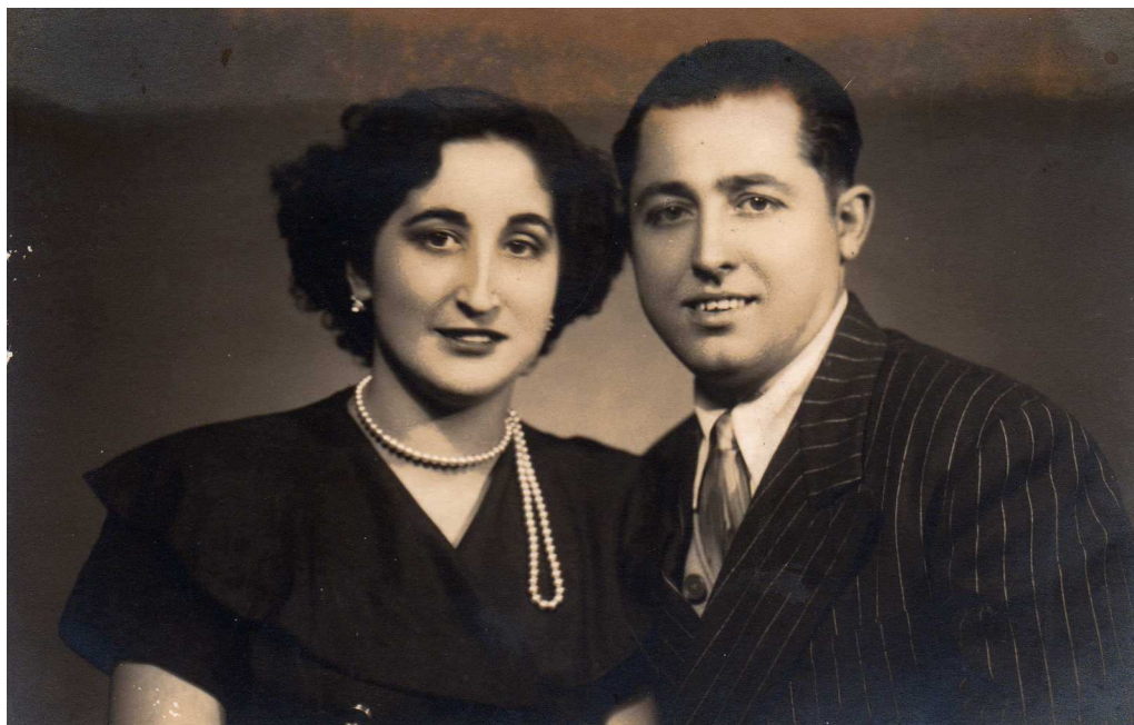
Noivos de S. Xoán no ano 1944

Pero ela, feminista convencida, e indignada, lonxe de amilanarse, sinaloulles o ridículo e anticuado das súas obxeccións e, aproveitando o auditorio, informounos do seu pensamento sobre a igualdade de dereitos entre a muller e o home, e outros asuntos relacionados. Os gardas, atónitos, non atinaron a rebatir os seus argumentos, e, indecisos, deixárona proseguir soa o seu camiño que por certo siguiu percorrendo cantas veces lle deu a gaña sen maiores contratempos.